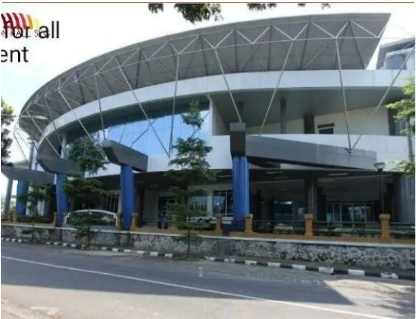
Gedung Convention Hall Sim pang Lima Gumul Kabupaten Kediri.

Kediri - Sebuah bangunan gedung serbaguna yang menjadi pusat perhatian masyarakat Jawa Timur terletak di kawasan Kabupaten Kediri yang strategis, yakni Gedung Convention Hall di wilayah Sim pang Lima Gumul (SLG), bangunan ini tidak hanya menawarkan desain arsitektur yang megah, tetapi juga